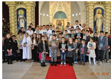
De feestelijk uitreiking van de kinderbijbels. Kerstmis 2015

( http://www.okkn.nl/pagina/3797/syrische_kinderbijbels )