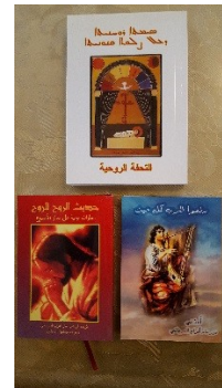
Enkele gewenste boeken

( http://www.okkn.nl/pagina/3797/syrische_kinderbijbels )