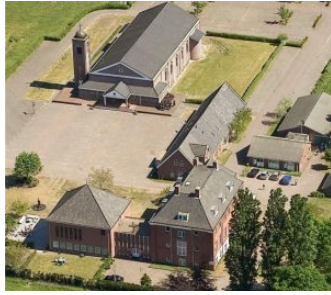
Het Syrisch orth. klooster te Glane (Zie http://www.morephrem.com/nl/ )

In Glane bij Enschede ligt het Syrisch Orthodoxe klooster Mor Ephrem. Sinds 1981 wordt van hieruit veel hulp geboden aan de Syrische vluchtelingen in Nederland (en Duitsland) bij hun integratie in de samenleving. Ook op religieus gebied zijn er allerlei projecten om de vaak getraumatiseerde vluchtelingen en hun kinderen zo goed mogelijk op te vangen en te ondersteunen in het weer oppakken van hun leven.